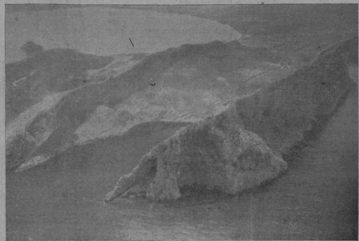
Magnífica vista aérea de la Punta Troneta cuya voladura ha empezado esta mañana.