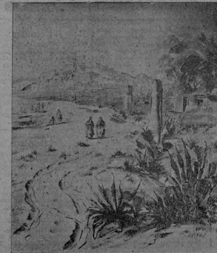
En las Galerías Costa. — Ibiza desde Talamanca, acuarela Juan Ribas