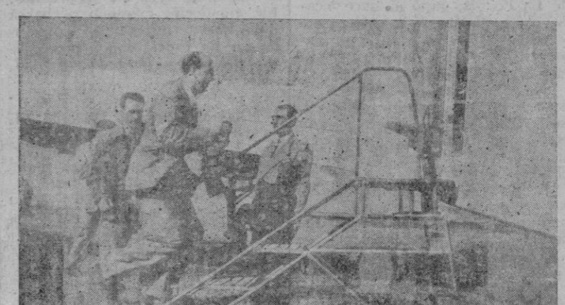
HUMBERTO DE SABOYA, DESPUES DE BREVE DESCANSO EN BARCELONA, TOMA EN EL AERODROMO DE PRAT DEL LLOBREGAT, EL AVION EN QUE HA REALIZADO EL VIAJE A PORTUGAL

Roma, 16. — Después de expresar su creencia, de que el futuro gobierno italiano será de coalición de demócratas, cristianos, socialistas y comunistas, Nenni hizo resaltar que, con todo, no se dispone todavía de elementos decisivos para pronunciar la composición de aqué-