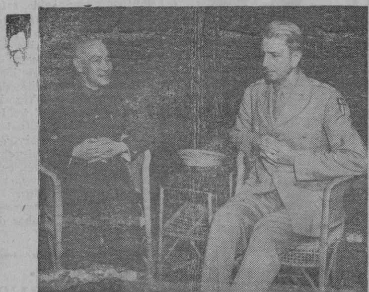
EL GENERALISIMO CHINO.—El Generalísimo chino, Ching Kai Kai conversa con el General Wedemeyer, jefe de las fuerzas militares norteamericanas en China.