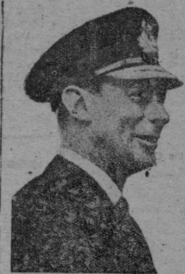
El Rey Jorge VI de Inglaterra

Londres. — En la iglesia de Santa Margarita se ha celebrado una solemne función religiosa