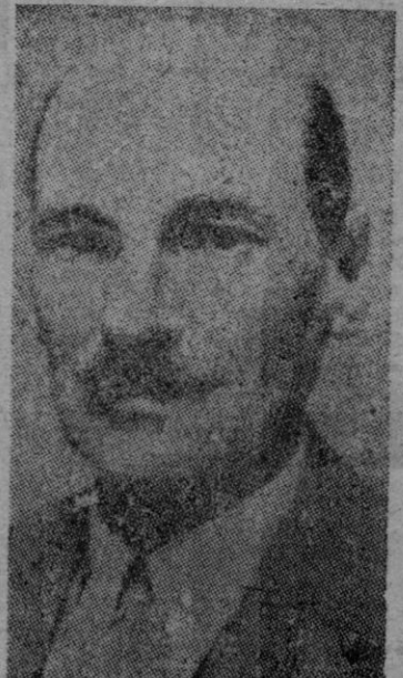
felicitó al Rey por la victoria y terminación de la guerra y se le felicitó

El Primer Ministro Attlee presentó una moción en la cual se