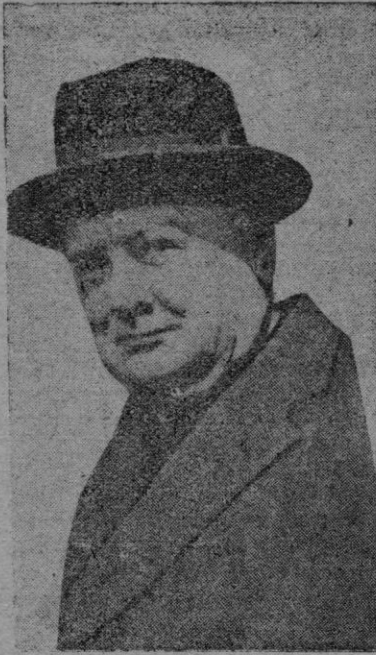
Winston Churchill, el hombre dinámico de los grandes días

Acabamos de dar las gracias al Todopoderoso por la liberación de nuestro país de los múltiples peligros que le han acechado durante tanto tiempo y por la victoria concedida a las fuerzas de las naciones unidas sobre el agresor japonés mediante la rendición del último de nuestros enemigos. Es por lo tanto justo que nuestra primera moción sea expresión de nuestra lealtad y de nuestra gratitud al Soberano. Hace exactamente tres meses que en esta misma Cámara el entonces Primer Ministro presentó una moción semejante con motivo del fin de la guerra contra Alemania. En aquella ocasión la Cámara apoyó sin reserva la prosecución de la guerra contra el Japón. Creo que pocos de los que estamos presentes, que el final vendría tan pronto. Pocos previeron las distintas circunstancias en que sería presentada esta moción. Hemos tenido unas elecciones generales que han introducido grandes cambios en la composición de esta Cámara. Hemos cambiado el Gobierno pero dentro de las modificaciones hay cosas que han permanecido inalterables, entre ellas está la lealtad y devoción a la Casa Real y la gloria de nuestras instituciones democráticas consiste en que los cambios introducidos por la voluntad del pueblo que en otros países se efectúan con frecuencia mediante luchas y derramamientos de sangre tenga lugar