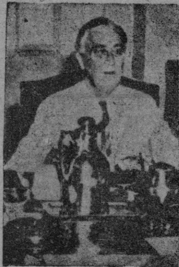
Roosevelt, el factor de la victoria.

Manila. — El General MacArthur ha enviado un radiomensaje a Hiro-Hito, pidiendo a los japoneses que se pongan en contacto con él para la ce-