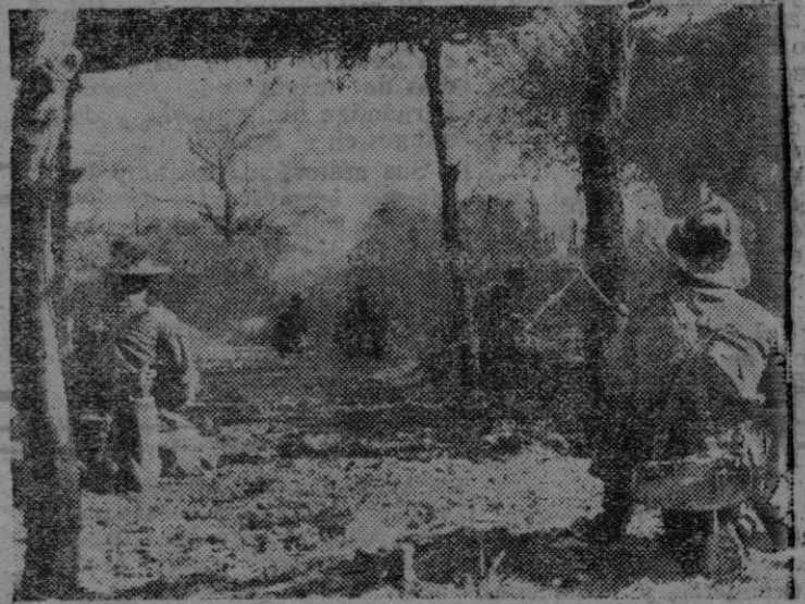
Tropas inglesas del XIV Ejército, atacan las posiciones japonesas del frente birmano, durante la actual ofensiva.