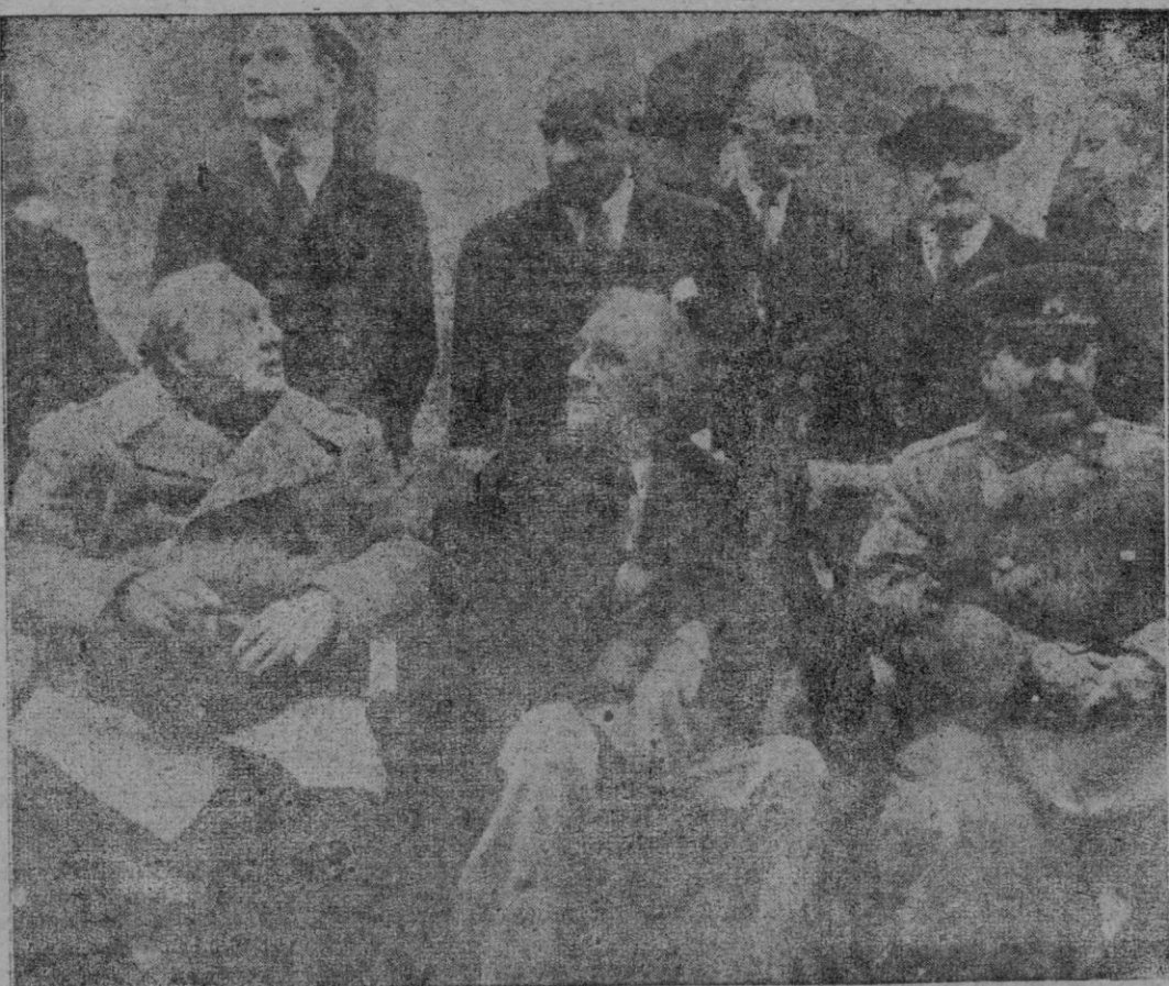
En primer término Mr. Churchill, el presidente Roosevelt y Stalin, acompañados de sus principales colaboradores. De izquierda a derecha, en segundo término: Mr. Eden, Mister Stettinius, Sir Alexander, Molotov, y Averit Harriman, embajador norteamericano en Moscú