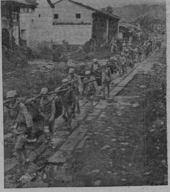
Tropas chinas a su paso por una calle de Tengchung, después de derrotar a la guarnición japonesa en una batalla que duró cinco semanas