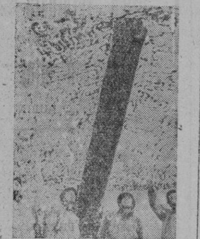
Bajo una red de camuflaje los soldados aliados examinan un obús de 240 mm. en acción en el frente italiano.

Al norte y noroeste de Polotsk los bolcheviques no realizaron ayer más que ataques débiles y fracasaron ante nuestras posiciones.