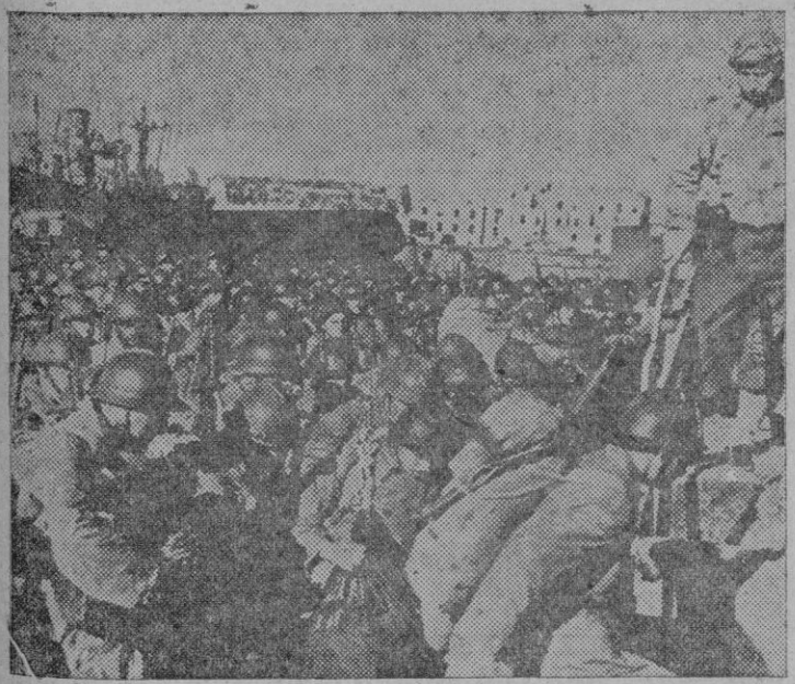
Tropas del Cuerpo Expedicionario Francés desembarcando en un puerto italiano para unirse a las fuerzas del 5.º Ejército aliado.