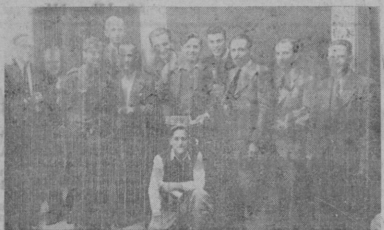
Ganadores de nuestro concurso y concurrentes a acto del sorteo de premios.

Ayer fué efectuado el sorteo de premios y hecha entrega de ellos a los vencedores.