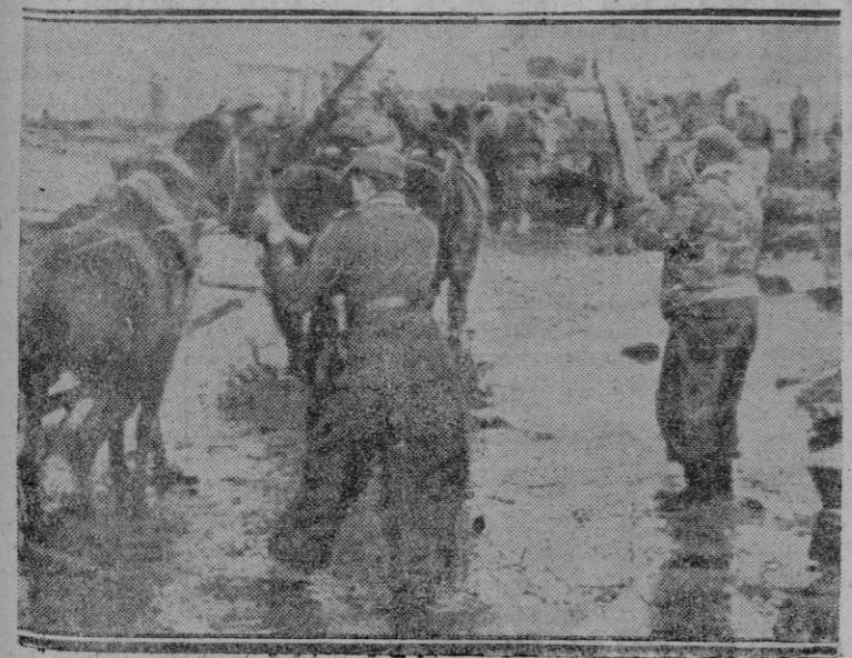
EL DESHIELO EN EL ESTE.—La época del deshielo ha comenzado en el Este. Ello no impide la libertad de acción y movimiento de las tropas alemanas y la munición llegan siempre a los lugares precisos.