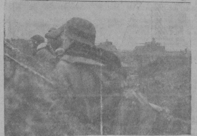
LA GUERRA EN EL ESTE.—En los hoyos de las granadas, los infantes alemanes, protegidos por tanques se mantienen firmes librando las más terribles batallas.