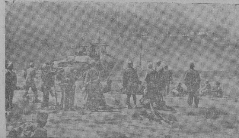
Escena de la guerra en el Norte de Africa. Los grupos de infantería italo-alemanes esperan el momento del ataque mientras las formaciones blindadas de Rommel se lanzan con decisión y fiereza al ataque con toda violencia.

cantes que integraban aproximadamente ambos convoyes, sólo dos arribaron a Malta. Así se de-