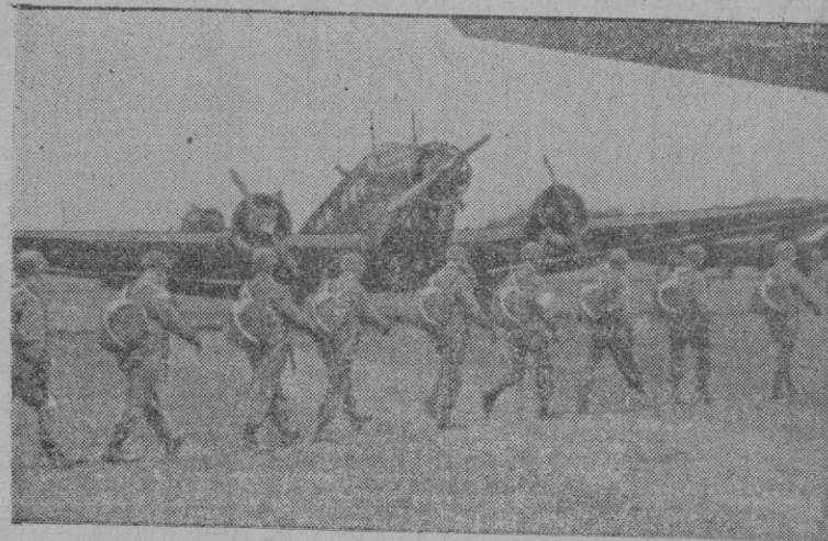
El preliminar de la acción.—Paracaidistas almanes se dirige al avión de transporte, para efectuar un vuelo contra el enemigo.

DIFICULTADES DE SU PASO A fines del año anterior, los ingleses habían cogido a Trípoli, desde Malta y Bengasi, en una tenaza aérea. Ello dificultó mucho el paso por el Mediterráneo de refuerzos para las tropas germano-italianas. Esta tenaza británica fue destruida por los grandes ataques contra Malta que comenzaron a principios de Junio y continuaron sin tregua hasta Abril. La eliminación de Malta tuvo por efecto que a las dos semanas de empezar los grandes ataques no se produjeron más agresiones aéreas contra Trípoli y que estuviera franco para los refuerzos el camino del mar. Con la conquista de Bengasi fue definitivamente liberado Trípoli del peligro de caer nuevamente en una tenaza aérea. El avance posterior de Rommel, la conquista de Tobruk y la progresión hasta el interior de Egipto han costado a