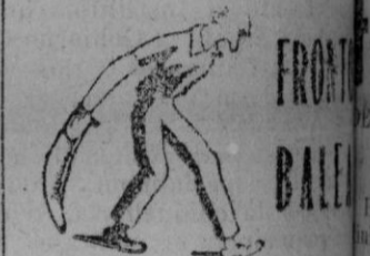
Hoy Jueves 29 Febrero NOCHE a las 9 y media ORTEGO II—TERRAS REMENTERIA—MARCO—GAMBOA—LOYOLA—ZULAIKA—IRIONDO Y ZULAIKA.

Se ha establecido en Estambul una comisión que está cargada de autorizar el tráfico a puertos extranjeros de buques turcos en caso de necesidad urgente.