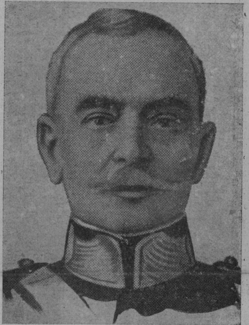
EL PRESIDENTE DE PORTUGAL

Al anochecer tuvo lugar un Rosario procesional para trasladar la imagen desde la Catedral al glorioso monumento. Asistieron también las autoridades, el Obispo, las Jerarquías del Movimiento, las fuerzas