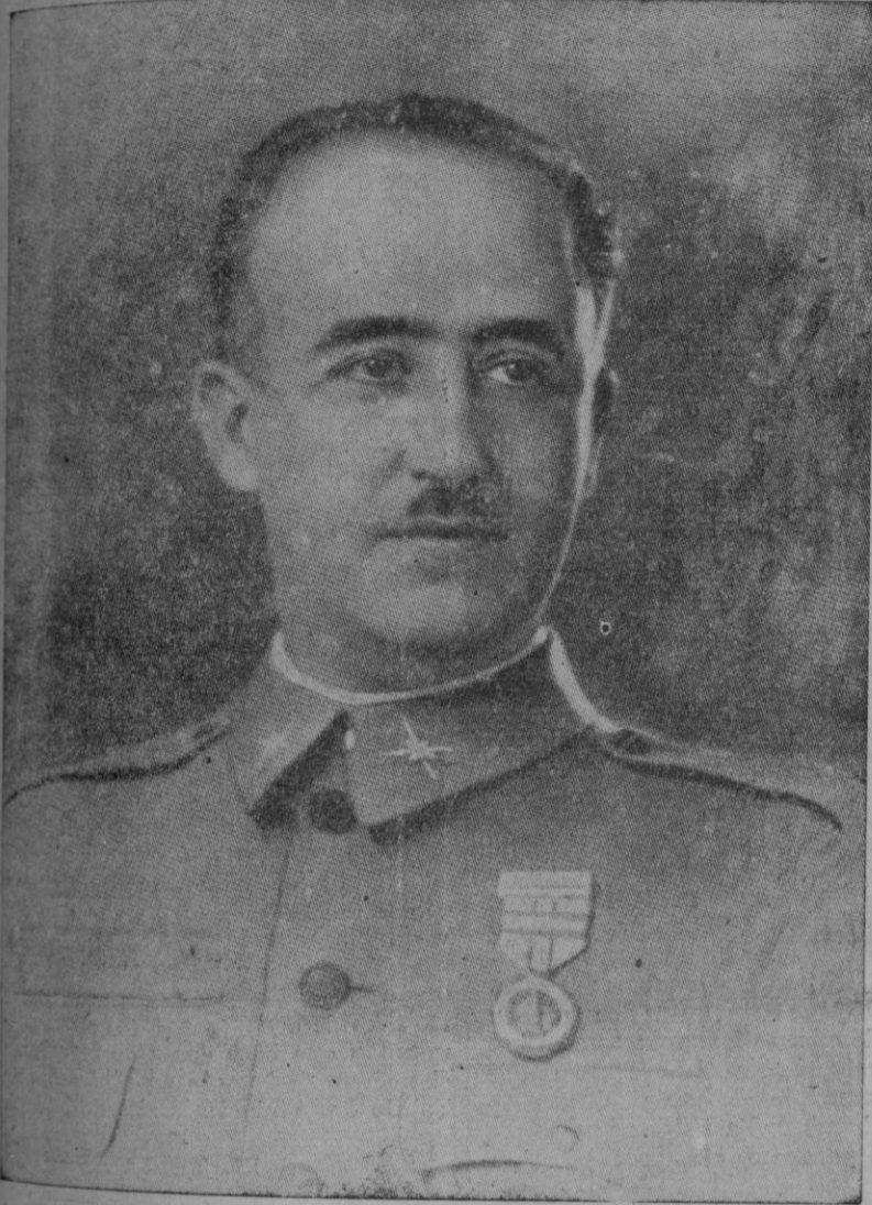
EL JEFE DEL ESTADO ESPAÑOL

Las dos naciones hermanas van a la par hacia sus altos destinos históricos. — Discursos del Excmo. Sr. Ministro del Interior, del Embajador de Portugal y del héroe glorioso de Toledo.—La vieja capital imperial ha celebrado dignamente la gloriosa conmemoración