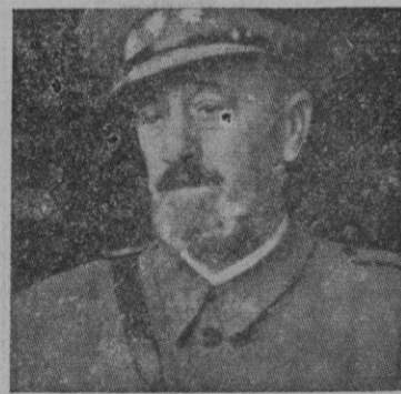
EL GENERAL MOSCARDÓ

Las consignas que debieron producir tan heroica resistencia, fueron sin duda las de la civilización universal porque llegaron al extremo de no saber si alguien iba a preocuparse entre sus hermanos de acudir a socorrerlos. Las únicas noticias que se recibían eran las tendenciosas que daba Unión Radio hasta que un buen día, percibieron las ondas de Radio