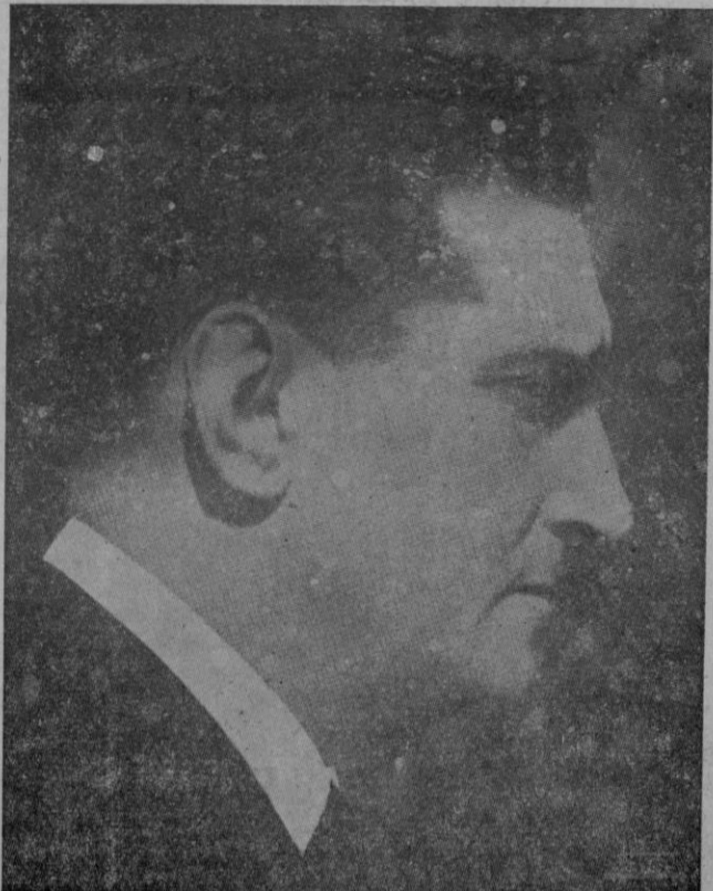
EL JEFE DEL GOBIERNO PORTUGUES