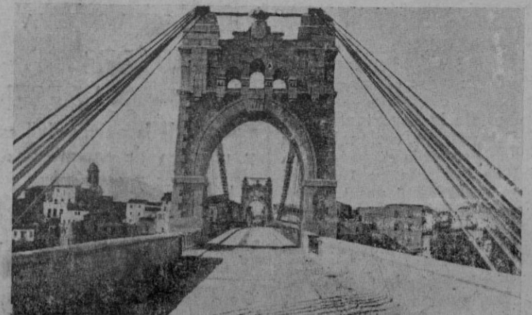
Uno de los famosos puentes sobre el Ebro, en Tortosa, volado por los rojos en su huida.

Era el año 1535 cuando Francisco Pizarro, conquistador del Perú y fundador y colonizador de varias ciudades entre ellas la de los reyes (Cajamarca) tuvo referencias que en el oriente de Quito hoy capital del Ecuador existían terrenos veracisimos abundantes en minas y próximos a un río tan grande que parecía el mar. Intrigado con tales noticias comisionó a su paisano y Capitán Orellana, a intentar la operación, quien en lucha diaria con las mil adversidades, que las aguas, la tierra, las tribus, las fieras, el clima y los insectos le presentaban, bajó por las aguas del Napo hasta la confluencia de aquel río caudaloso, encargado de colorar, por el que navegó durante varios años hasta desembocar en el mar, después de un recorrido de más de diez mil kilómetros, salvándose sólo una tercera parte de sus hombres y realizando una hazaña tan colosal, que según todos los historiadores constituye la proeza geográfica más grande