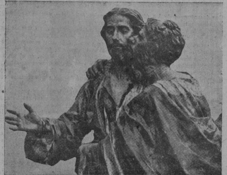
Fragmento de un grupo escultórico de Salzillo

adorareis al Padre. Vosotros adorais lo que no sabeis y nosotros lo que adoramos, porque la salud viene de Judea.