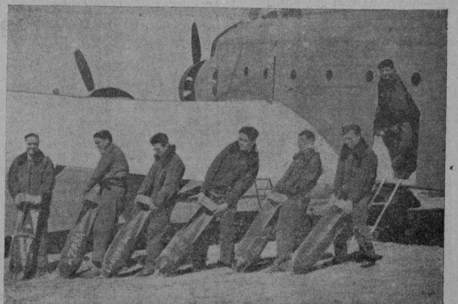
En uno de los campos de aviación de España. Preciosa carga que seguramente llegará a destino

Tiempo frío: en tu hogar acogedor y templado disfrutas de oves. No olvides al que te lo detiene bajo la lluvia y la helada.