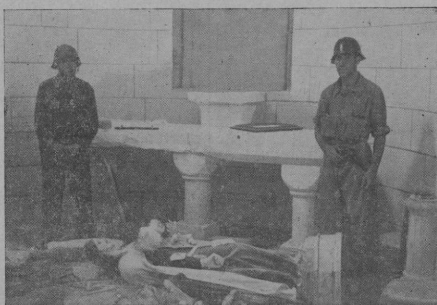
Aspecto del altar de la Iglesia de San Carrió profanada por los rojos.