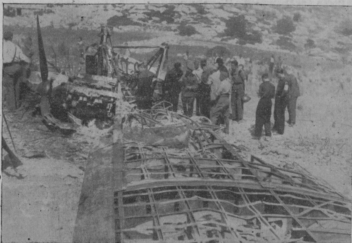
Aspecto que ofrecían los restos del avión rojo derribado esta mañana por nuestros heroicos cazas, entre Andraitx y Estallenchs.

si son los Nacionales. Estos, estos son los que saben y pueden reconstruir un estado que los otros se esfuerzan en destruir. Estos son los que pueden sentir un ideal hondamen-