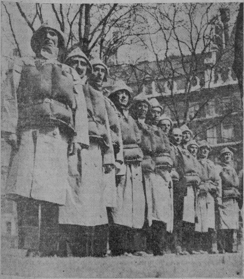
Marinos ingleses que por haber salvado náufragos han sido condecorados, reunidos en Londres para el acto de imposición de las medallas.

Discurso de hombre de gobierno el del señor Prieto. ¿Que duda tiene! Discurso saturado de enseñanzas y de sugerencias; discurso henchido de españolismo, tal y como se debe sentir en el año que corremos de este vigésimo siglo, en el que estamos asistiendo al desajustamiento de cuanto imperó como producto de las doctrinas enciclopedistas, que fueron antorchaque alumbró a la humanidad desde casi la mitad del XVIII, la que ya consumida sólo queda una débil llama cáldida y temblorosa. La realidad presente, para el señor Prieto, no es de desmanes. Tiene razón, como también la tiene al decir que lo que no puede soportar el país es la sangría constante del desorden público sin una finalidad revolucionaria inmediata. Esta frase, que ha sido muy discutida refleja un estado de ánimo que no se descubre a primera vista. ¿Es que quiere la finalidad revolucionaria? En modo alguno, má xime cuando en párrafos anteriores dejó dicho que en los desmanes que se cometían no veía signo alguno de fortaleza revolucionaria. Y es verdad. La fuerza de la revolución son las ideas no las actitudes. Hizo más por ella Voltaire que Petión.