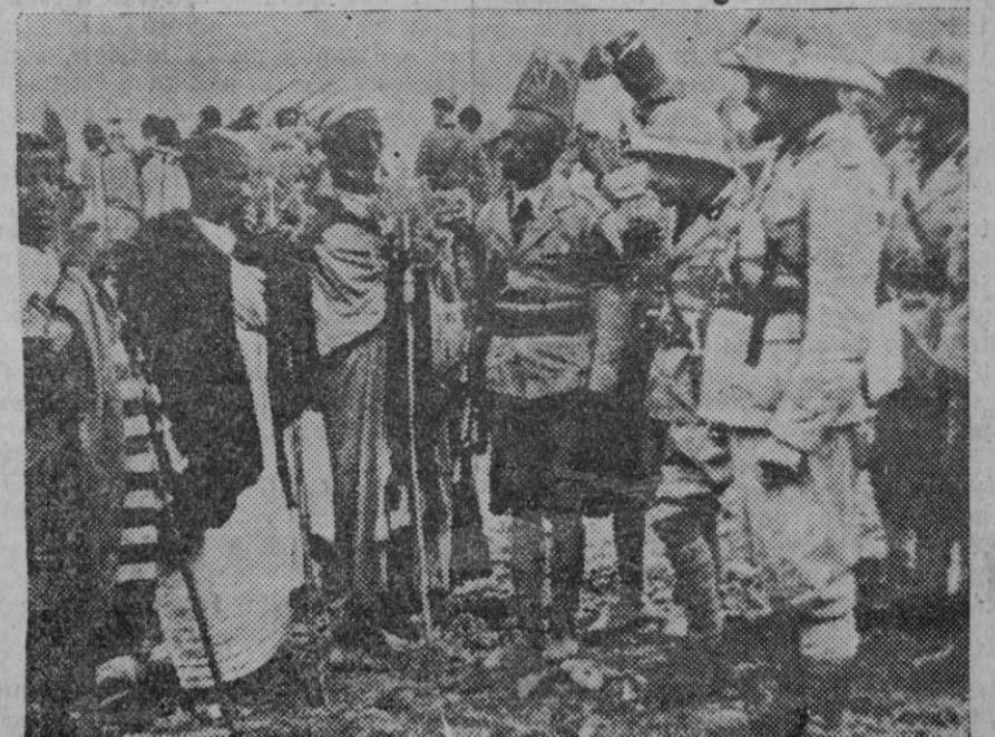
Tropas abisinias haciendo acto de sumisión después de la ocupación de Addis Abeba.