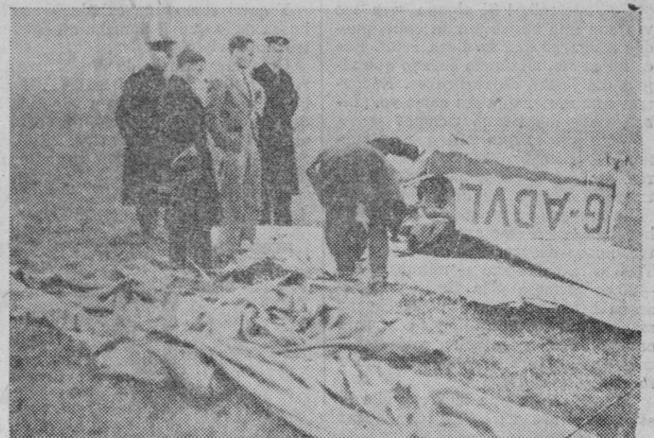
La primera «pulga del aire» que ha sufrido accidente ha sido ésta. El piloto pereció. El accidente ocurrió en Laglaterra.