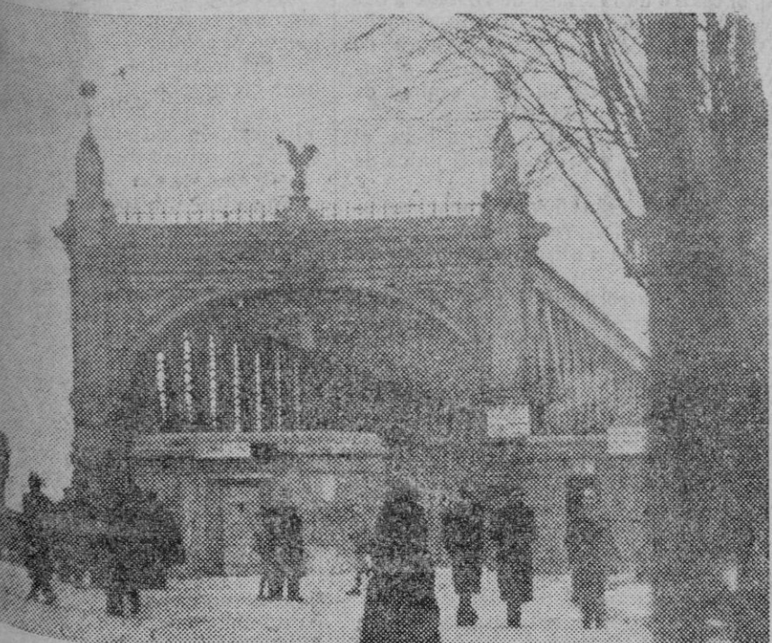
El puente de Khel, sobre el Rhin, en la frontera franco prusiana, está severamente custodiado.