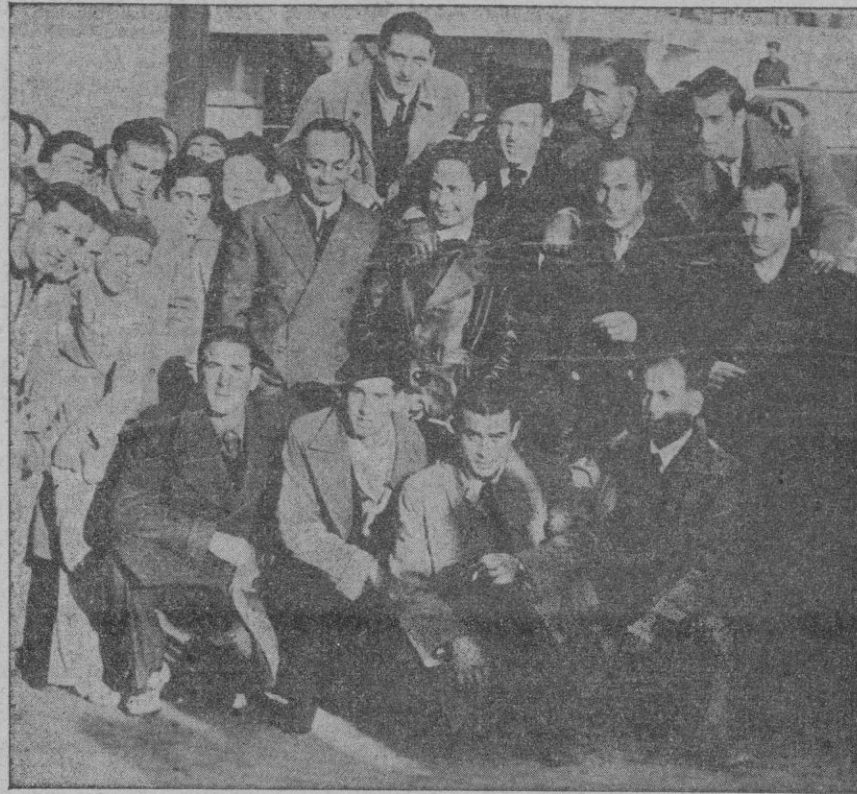
Los jugadores del equipo Oviedo F. C., llegados esta mañana a Palma, que mañana se enfrentarán con el C. D. Mallorca, en el campo de Buenos Aires.