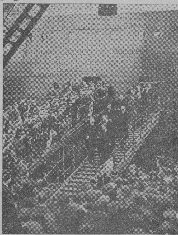
El Rey Eduardo VIII al salir de visitar el «Queen Mary», el mayor trasatlántico del mundo que en breve realizará su primer viaje.

la absoluta precisión por todos reconocida de promover trabajo para dar ocupación a los que no la tienen, creemos que si se consiguiere aunar en una acción común la gestión de los que hemos aludido, conseguiríamos lo que desde hace tanto tiempo venimos persiguiendo.