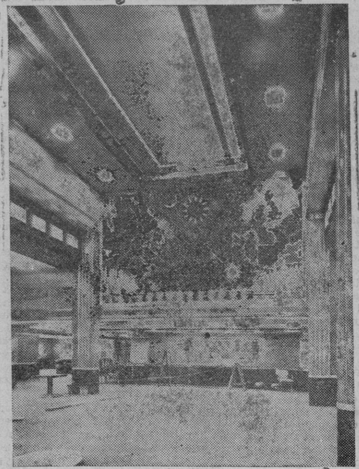
El espléndido salón del trasatlántico «Queen Mary», donde está instalado el comedor de primera clase.

J. L. Claparede indica dos condiciones primordiales para llevar a vías de hecho el proyecto de reformas en la enseñanza de la Historia. Una coordinación de esfuerzos de todos los factores que pueden intervenir en la cuestión educativa, para lo cual pugna por la creación de un organismo que goce de la confianza de las organizaciones de enseñanza primaria, estando además este organismo en contacto con la Sociedad de Naciones. La finalidad de esa institución que propugna Claparede sería—entre otras cosas—establecer un sistema que permitiese el control general y permanente de los manuales de historia; y además velaría porque los maestros de todos los países fuesen iniciados en los nuevos métodos de enseñanza de la Historia. Aparte de este organismo haría falta una perfecta colaboración de los historiadores. Aunque estos pueden recabar su libertad de criterio para enjuiciar los hechos históricos, es indudable que esa libertad no es incompatible con el deber moral de condenar la guerra y de no herir la dignidad de los otros países.