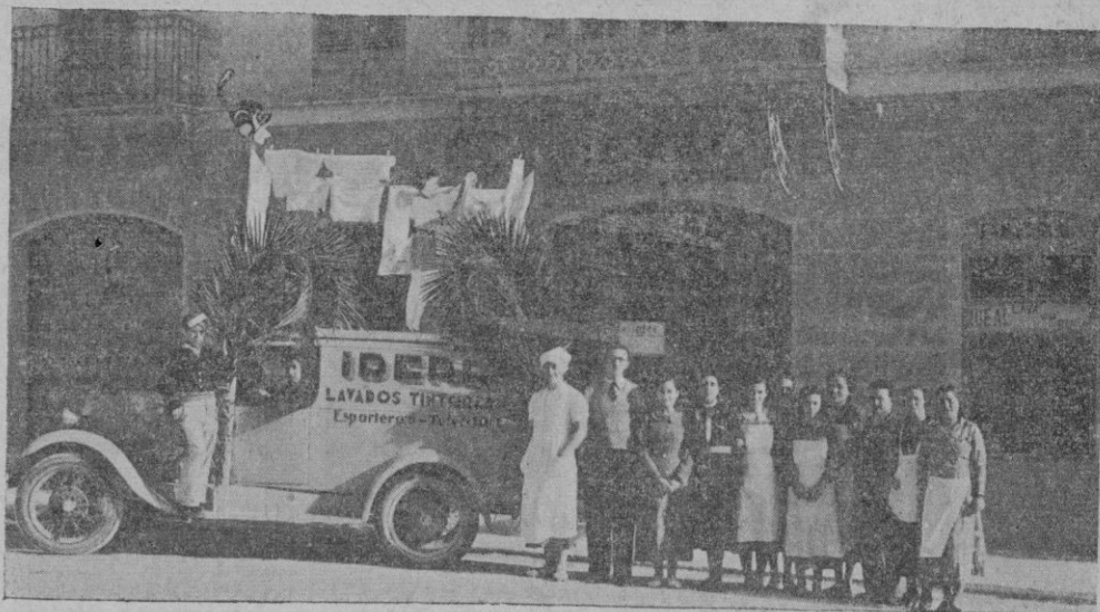
IDEAL LAVA SU ROPA LLAME SIEMPRE AL TELEFONO NUM. 1011

Larga sería si tuviéramos que hacer una relación y reseña de cada uno