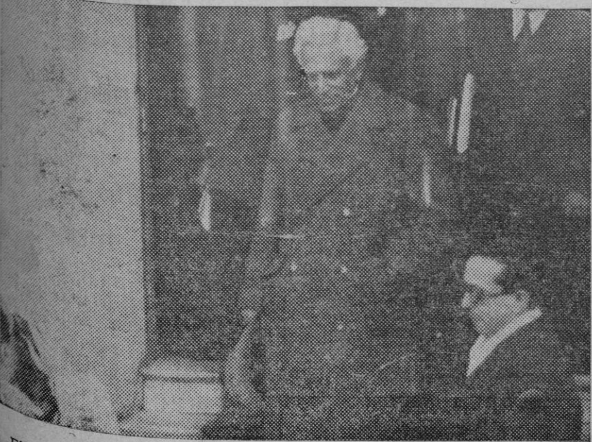
El Sr. Portela Valladares al salir de Palacio después de haber presentado la dimisión.