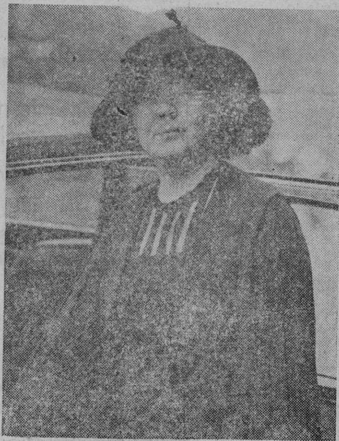
La famosa sufragista inglesa Pankhurst, que ha sido nombrada Dama de Honor del Imperio Británico.

La primera sección muestra, en representaciones gráficas y estadísticas, la importancia de la agricultura en general y su vinculación con la industria compradora de artículos alimen-