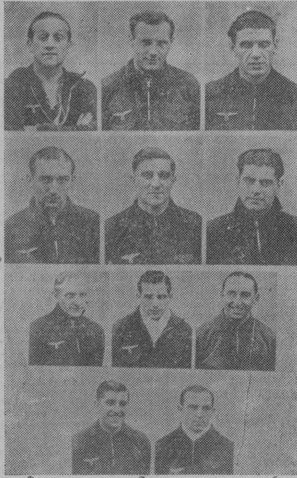
El equipo alemán que luchará con la selección española en el estadio de Montjuich, formado por Haminger (defensa), Jakob (portero), Munsenberg (defensa), Gramlich, Goldbrunner, Janes (medios), Szepan, Hohmann, Fath Lehener, Rasselnberg (delanteros)

Para ello la insistencia puede ser eficaz.