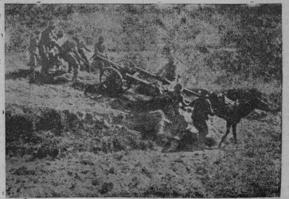
Un avance de la artillería italiana en el frente Sur. (Express Foto).