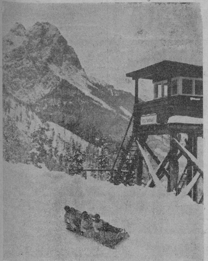
La curva «del nido de Cornejas» de la pista de hielo de Garmisch, donde se juega la Olimpiada Blanca.