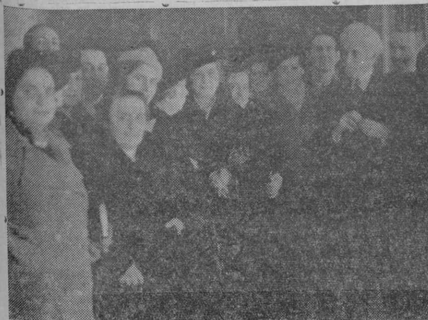
Comisión de la Agrupación femenina Antifascista, visitando al jefe del Gobierno Sr. Portela para pedirle sea puesta en libertad la propagandista «La Pasionaria».