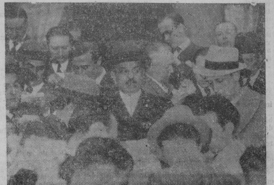
El Sr. Laval al salir de presentar la dimisión del Gobierno al Presidente de la República francesa.