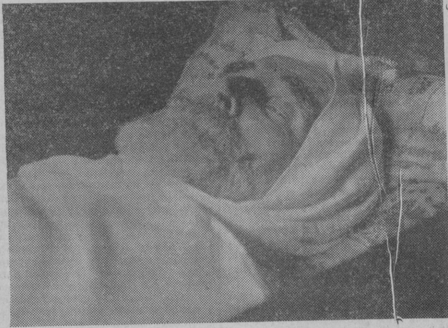
El genial escultor Miguel Blay, que ha fallecido en Madrid, en su lecho de muerte.

Mucho celebramos el propósito de la Comisión Especial de Ensanche, a cuya realización hemos de alentarle, en interés de todos, en beneficio para los vecinos de las zonas urbanas amenazados hoy de molestias que en forma alguna pueden ni deben ser toleradas, y en beneficio de los industriales que podrán con mayor garantía, acometer sus empresas, harto dificultadas hoy por no existir aquella zona por cuyo establecimiento nos interesamos, y que tiene en estudio la referida Comisión.