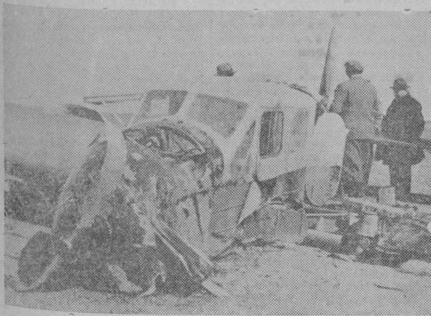
Restos del avión que ocupaban los aviadores Saint Exupery y Provost, que cayó en el desierto, a 200 kilómetros de El Cairo. Los aviadores fueron salvados por unos beduinos.