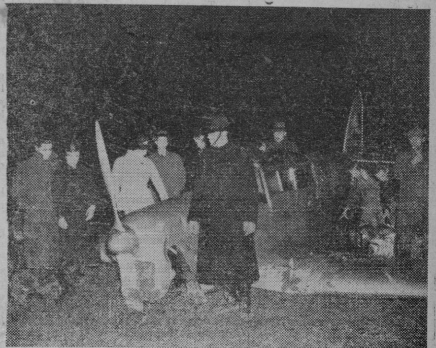
Estado en que quedó el aparato de la aviadora Batten, que cayó en Sussex, Inglaterra, y de cuyo accidente resultó indemne la famosa aviadora.