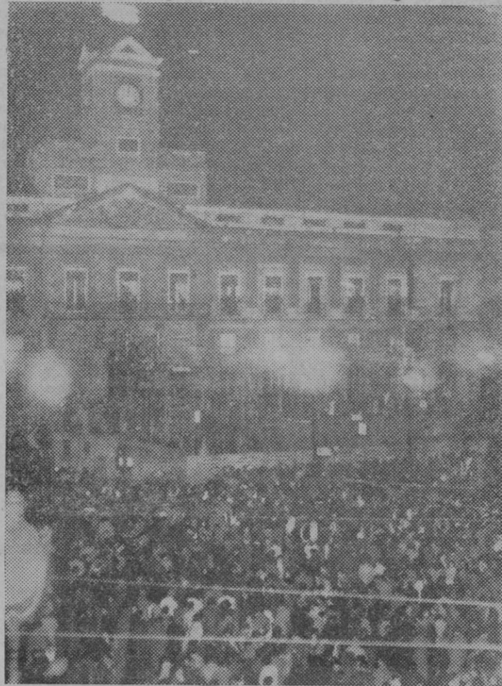
Aspecto que ofrecía la Puerta del Sol, de Madrid, cuando en el reloj de Gobernación sonaron las doce campanadas, al entrar el año nuevo.

¿Cuando se organizará en debida forma la inspección de los alimentos?