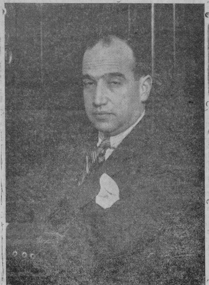
El nuevo Gobernador General de Cataluña señor Villalonga.

autárgicamente las provincias, reintegrado a los pueblos los patrimonios que les fueron usurpados, y reorganizado el crédito a corto y largo plazo, siquiera debe modificarse el Código para que "el insolvente, de mala fé pague en la cárcel; el día, en fin, en que tengamos buena administración y buen gobierno y como conse-