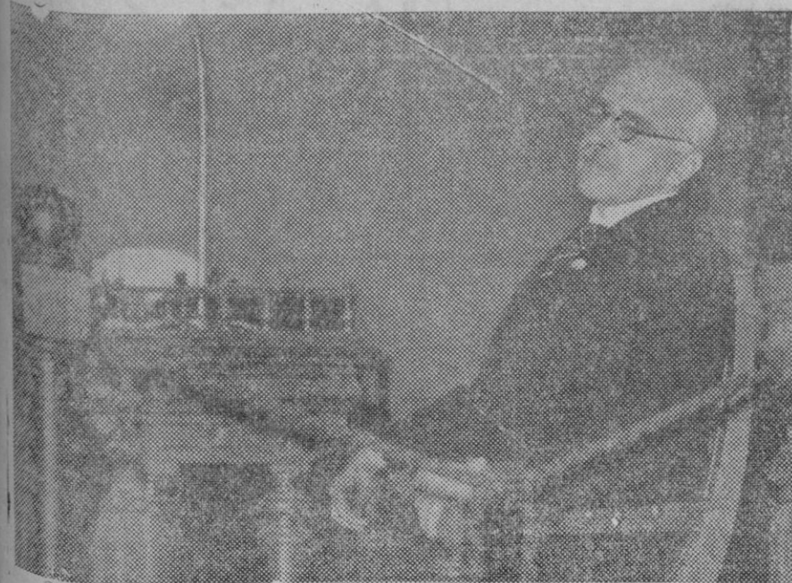
Don Julio Dantas, presidente de la Academia de la Lengua de España, que mientras daba una conferencia a la Academia de la Lengua Española, en Madrid, fué víctima de un robo. Los ladrones penetraron en la habitación del hotel donde se hospedaba llevándose dinero, alhajas y documentos, todo lo cual ha sido recuperado por la policía.