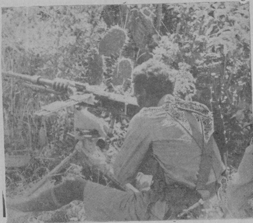
Un tirador abisinio disimula entre la maleza, la instalación de su ametralladora.