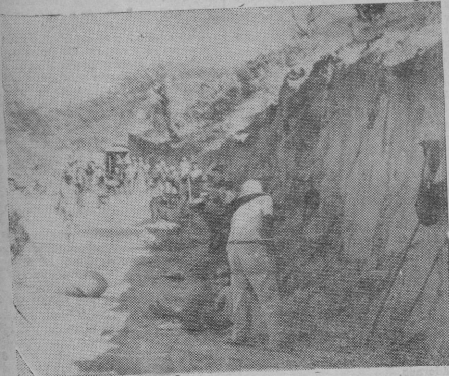
Una de las primeras fotografías llegadas del frente italiano en Abisinia, es esta en la que se ven las obras de construcción de carreteras que con gran actividad han comenzado para asegurar la relación del frente con las bases.