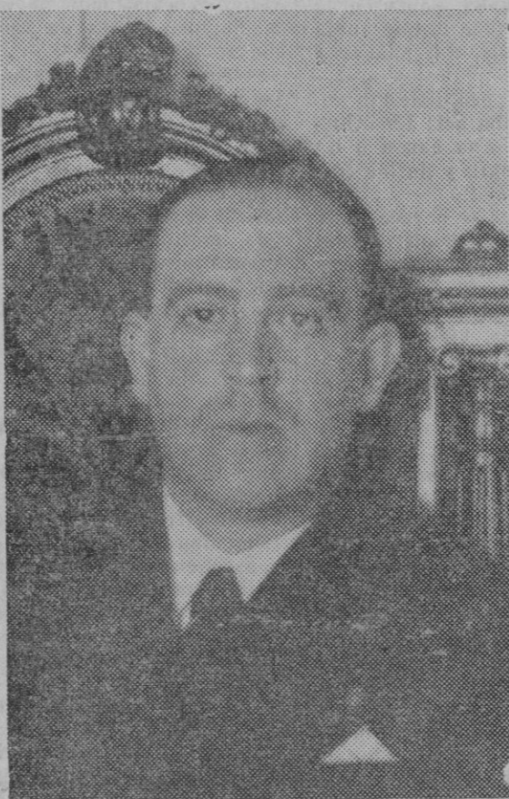
El nuevo Ministro de la Gobernación don Joaquín de Pablo Blanco.

Ojalá pronto podamos consignar la grata noticia de que las proyectadas obras van a ser subastadas.