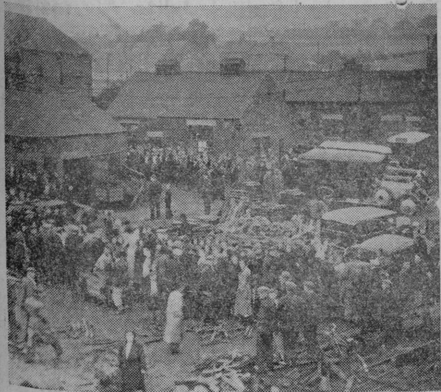
El pueblo de Barnsley (Inglaterra), ha sido escenario de un terrible catástrofe a causa de la explosión de una de sus minas. 16 hombres han encontrado la muerte al ser aplastados en uno de sus túneles. Esposas, madres, hijas y hermanas esperando en la entrada de la mina las últimas noticias de las víctimas de la explosión.