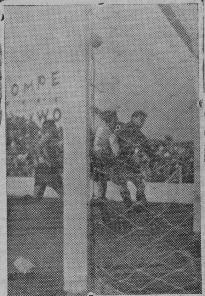
En el campo de la carretera de Sarriá y ante un numeroso público se jugó el domingo el encuentro entre los equipos Español y el Sabadell, con un resultado de 3 a 0, a favor del Español. Un momento del partido.

Estas fotos eran las de una dama de la buena sociedad de Lubiana, siendo muy comprometedoras. Los detectives hicieron entonces un registro que fué de los mas fructuosos. Descubrieron un fichero perfectamente al día, con fotografías escabrosas; en el reverso de cada una estaba colocada una indicación con el nombre, la situación de la fortuna de la víctima y el total de las sumas invertidas por ellas a título de rescate. Igualmente descubrieron encima del diván, cuidadosamente disimulado por un cuadro, un aparato