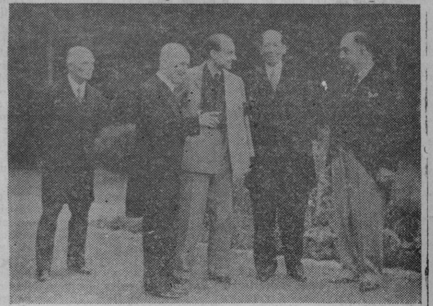
En Bled (Yugoeslavia), ha tenido lugar la conferencia de la pequeña entente. El príncipe regente Pablo de Yugoeslavia con los ministros autorizados de la pequeña entente, a la izquierda del regente Pablo, el Sr. Benes (Checoslovaquia), a la derecha el Ministro de Negocios Extranjeros de Rumania, Sr. Titulesco y el de Turquía señor Roushdi Aras.

Así está planteada la lucha, y ese es el cuadro político. Las izquierdas no llegan a un acuerdo. Su relación con los socialistas es—a causa de esa división de que hablaba antes—verdaderamente difícil. Entretanto, el gobierno se mantiene con absoluta cohesión y anuncia que en noviembre convocará elecciones para renovar los ayuntamientos y pulsar, de esa forma, la situación y la voluntad auténtica del país. Se discute en estos