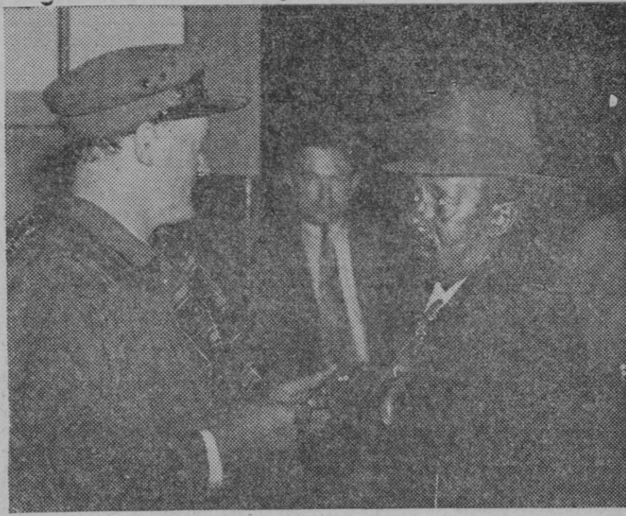
M. Tecla Hawariate, ministro de Abisinia en París acaba de llegar a Ginebra para tomar parte en la reunión de la Sociedad de Naciones sobre el conflicto italo-abisinio.

De esperar es que los Alcaldes, y por su parte los propietarios de los predios secundarán una idea que tan provechosa puede ser para esta isla en estos momentos en que no se puede regatear ningún esfuerzo ni sacrificio para contribuir a dar mayor actividad al mercado del trabajo.