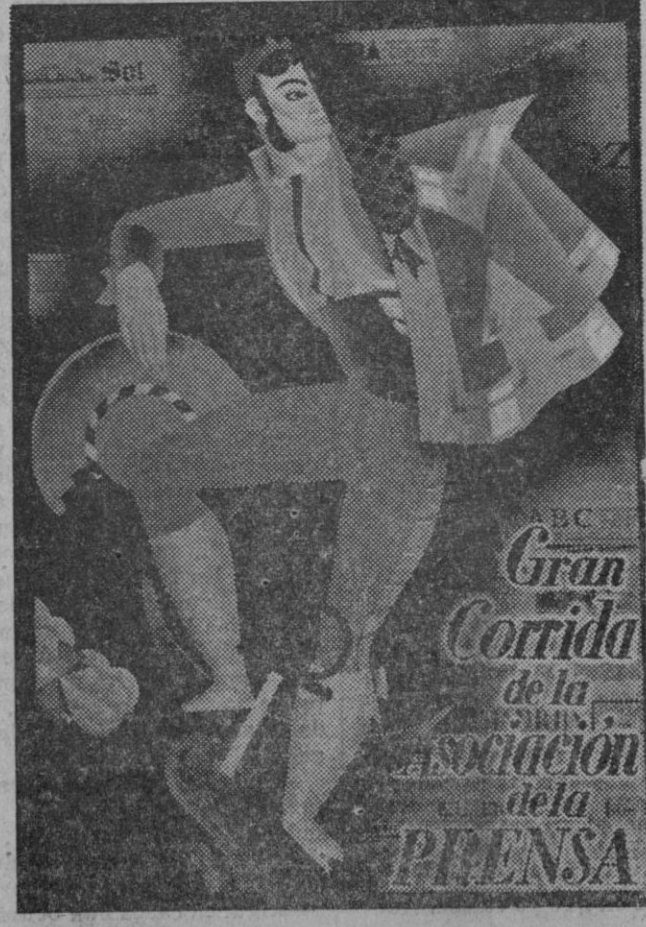
Dibujo que obtuvo uno de los primeros premios del concurso de carteles para la corrida de toros de la Asociación de la Prensa madrileña.

De una parte procurando una buena reglamentación de la lactancia y una relación perfecta entre el régi-