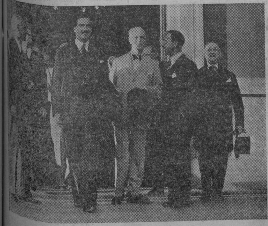
M. Anthony Eden ha llegado uno de estos últimos días a Roma para continuar sus entrevistas con el Sr. Mussolini. En la estación varias personalidades esperaban la llegada de M. Eden.