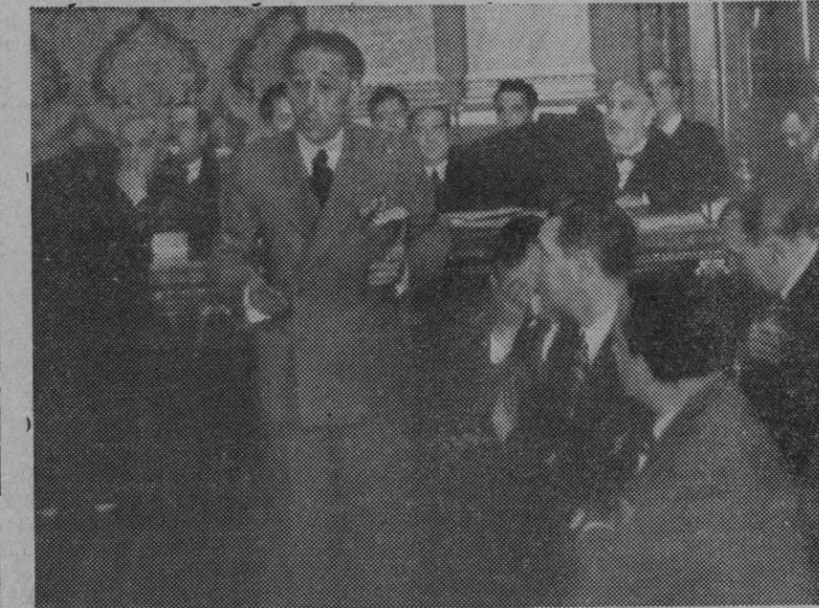
El ex-presidente de la Generalidad de Cataluña, prestando declaración en la vista-cause por los sucesos del 6 de Octubre desarrollados en Barcelona.

Y el perjuicio que ello irrogaría a Palma y a toda la región sería incalculable.