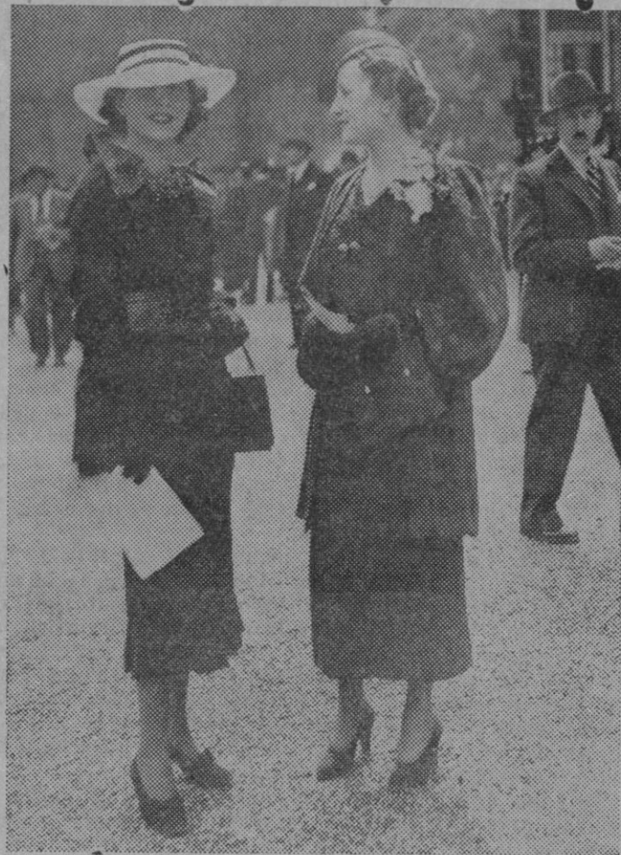
EL PREMIO «NOAILLES» EN LONGCHAMPS. — Con ocasión del Premio «Noailles», el hipódromo de Longchamps se vió muy concurrido, pudiéndose ver admirables toilettes. Una elegante paseándose.

original. —Combinando con un sombrero en cupucina, se lleva un grueso bouquet de violetas pasadas por la cinta.