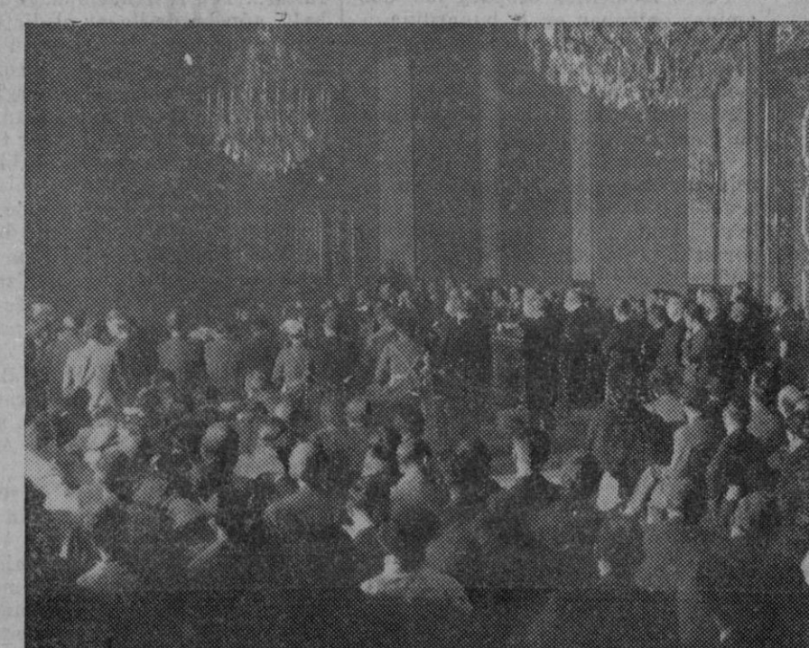
Un aspecto de la sala segunda del Supremo durante la vista de la causa contra los ex-consejeros de la Generalidad de Cataluña.