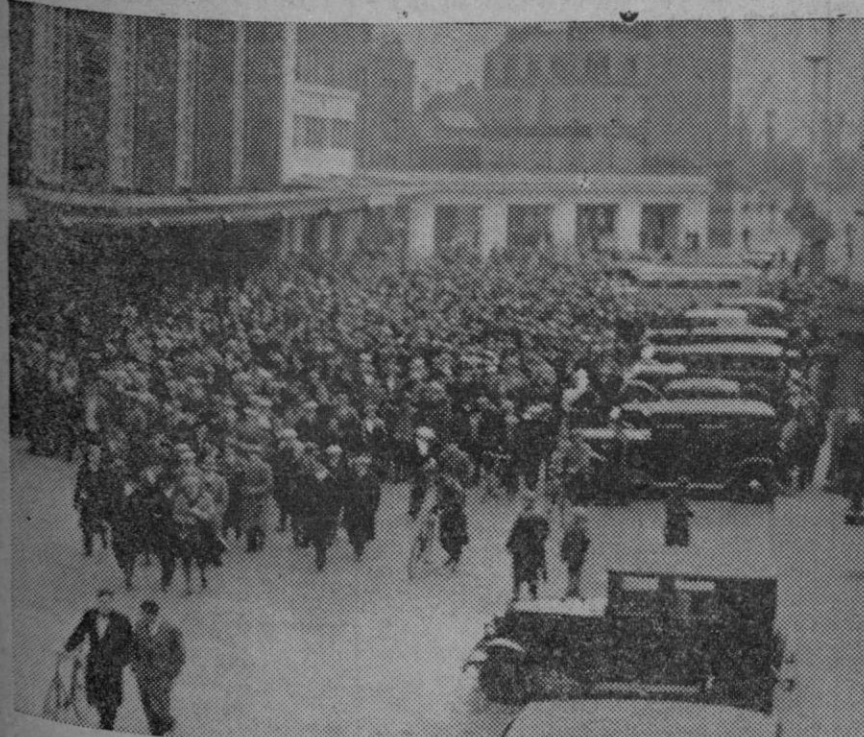
La huelga de los agentes de bordo de la compañía general Transatlántica, en el Havre aun no ha encontrado solución. Delante de la estación del Havre, la tripulación del paquebote "Champlain" y 2.000 de sus compañeros, forman cortejo a sus delegados, los cuales han celebrado una conferencia con el Ministro de la Marina Mercante aunque sin resultado.

Paso a refutar la expresión "lupus eritematoso" con argumentos claros, precisos y pregunta: "¿por qué llamarle lupus-Lobo, a un eritema que no ha roído nunca nada? Será todo lo tuberculoso que quieras, ya lo veremos, será,