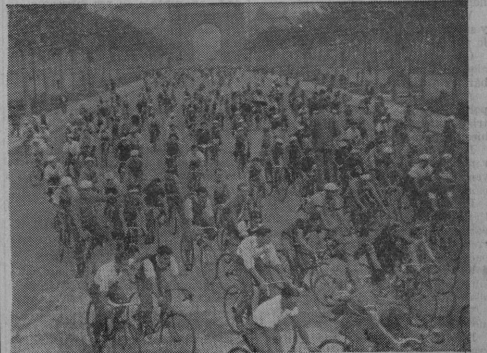
XXIII fiesta del pedal, la salida de Barcelona de los manifestantes al dirigirse a Sabadell donde se celebraron varios actos en honor de los ciclistas.