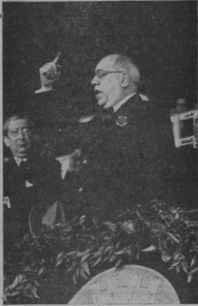
El Sr. Azaña, durante el discurso que pronunció anteayer en el campo de Mestalla, en Valencia.

De esperar es que las Corporaciones oficiales resuelvan de acuerdo con el interés general de la región.