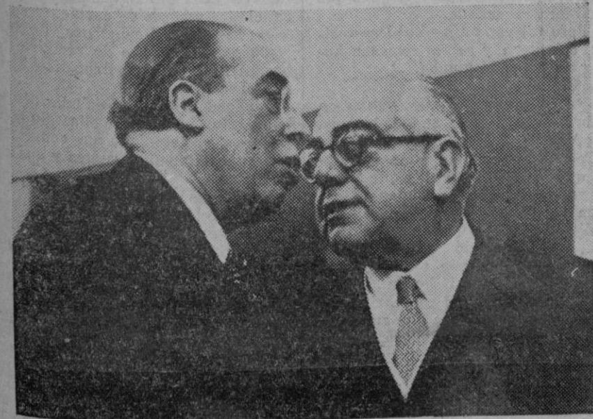
El Consejo de la Sociedad de Naciones ha tenido esta vez, graves discusiones en su orden del día, relativas al reglamento del conflicto italo-etiope. Los representantes de Portugal y de Persia hablando del conflicto.