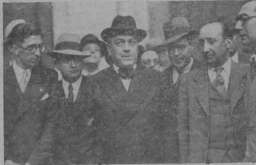
El Sr. Martínez Barrio, al salir de Palacio después de evacuar su consulta con el Presidente.

A la Diputación Provincial, al Ayuntamiento de Palma y a la Cámara de Comercio, apelamos para que no sea extinguida La Lonja, para que no se infiera este daño a nuestra región.