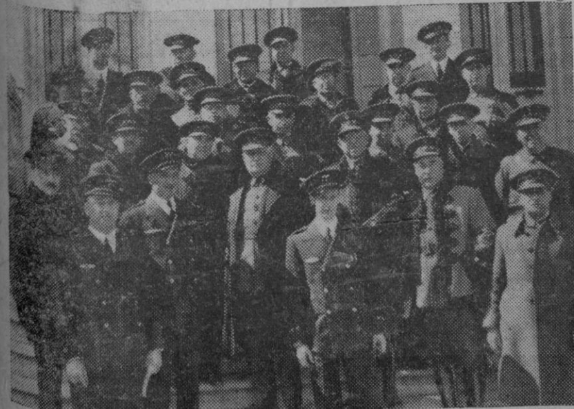
Jefes y oficiales de aviación fotografiados en el aeródromo de Cuatro Vientos, después de las maniobras aéreas verificadas días pasados