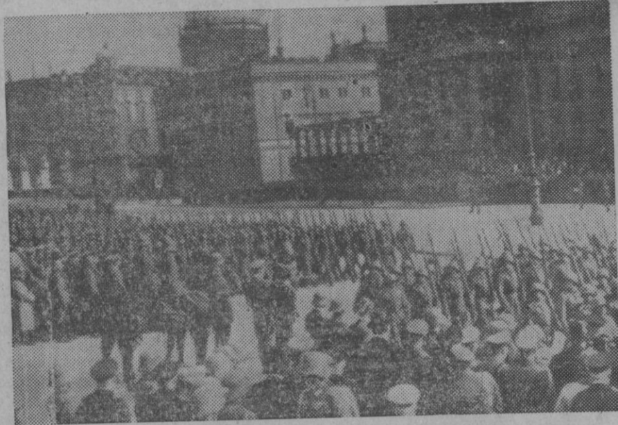
Después de la proclamación del Servicio Militar Obligatorio, el Canciller Hitler, acompañado del General Mackensen, presencia el desfile de la Unter den Linden.

Sólo así creemos viable una pronta solución, y ojalá nos equivocáramos pues nuestro deseo es de que cuanto antes el Gobierno Civil sea instalado con el decoro que el prestigio de ese centro oficial reclama.