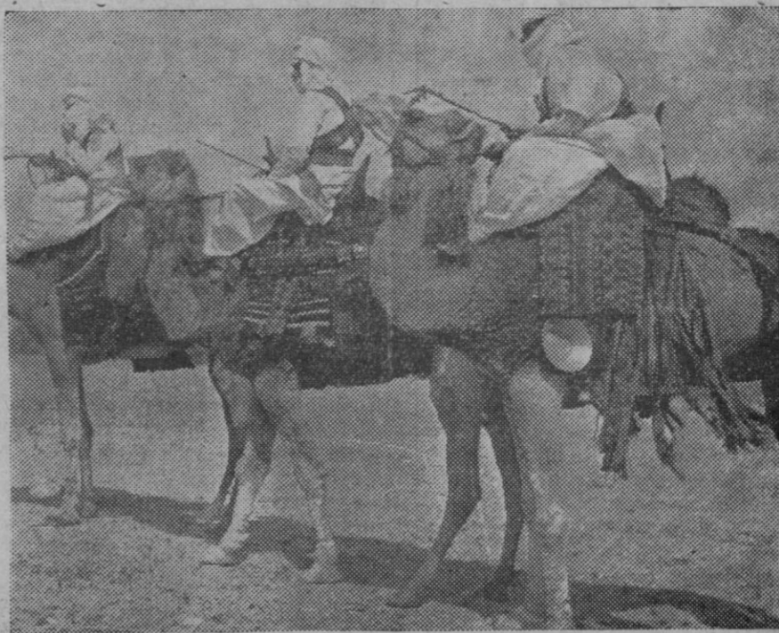
Continúan los preparativos italianos que contrastan con los buenos deseos de arreglar las diferencias pacíficamente que demuestran los abisinios. Una patrulla abisinia vigilando la frontera.

En cuanto a los periódicos, compraba muchos; pero también había suscritido la simpática treta de dar una propina a una mujer de las que limpian uno de los mejores coliseos de Madrid,