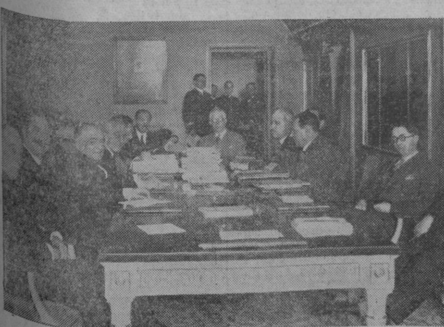
LAS NEGOCIACIONES ENTRE ESPAÑA Y FRANCIA. — Reunión de la comisión franco-española en el Ministerio de Estado para tratar del asunto de exportación.