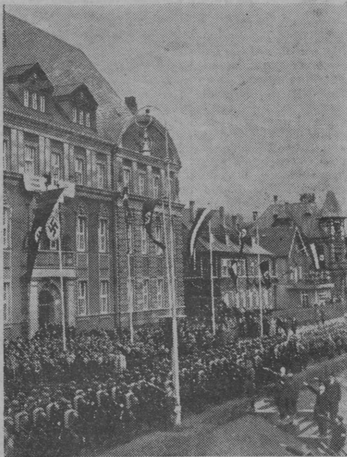
Con gran entusiasmo los sarreenses han celebrado la vuelta a Alemania de su territorio. Una de las calles de Sarrebruck (frente al Ayuntamiento) a la llegada de Hitler.

La comodidad del vecindario así le reclama y así conviene a la población que se haga.