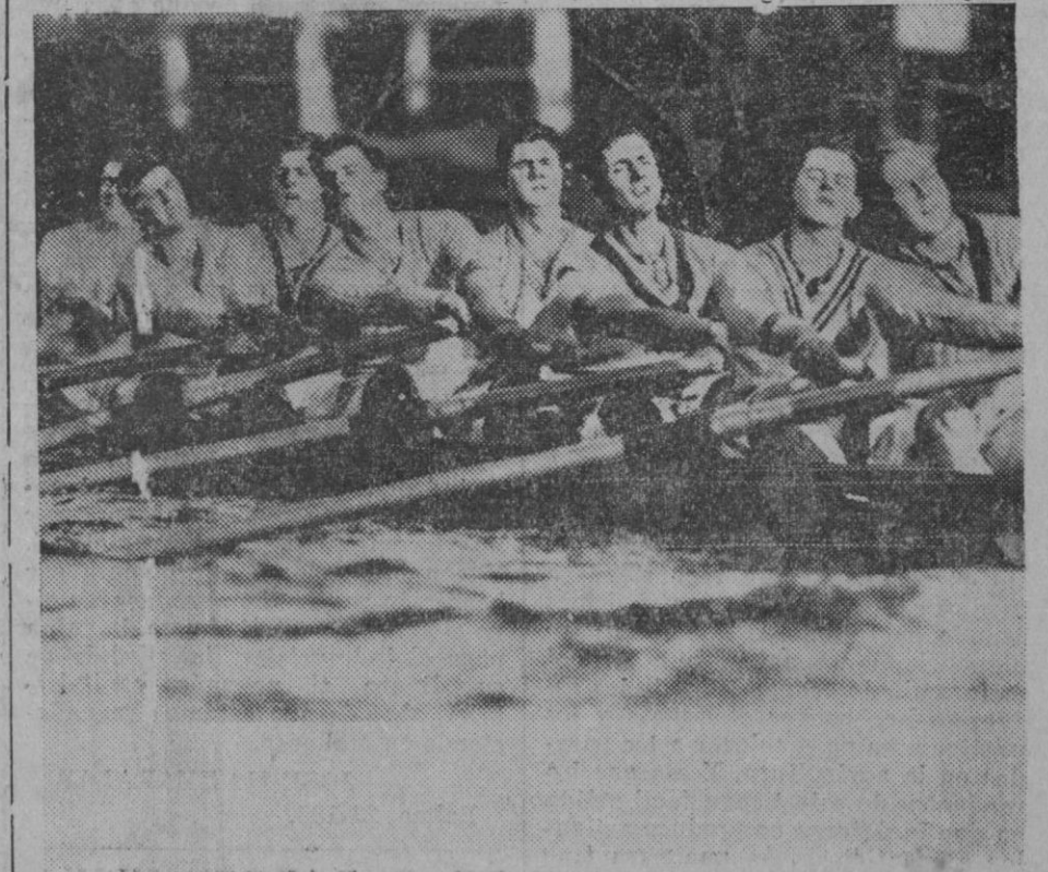
PREPARATIVOS PARA EL MATCH OXFORD-CAMBRIDGE. En vista del match anual que se celebra, en el Támesis y que enfrenta en el terreno deportivo a las Universidades de Oxford y Cambridge, apasionando al mundo entero, el equipo de Oxford, se está ya entrenando severamente. Una instantánea tomada durante los entrenamientos.

Es peligrosísimo repetir a secas, como ha dicho el gobernante francés: "no necesitamos doctores ni licenciados ni bachilleres sino labradores y obreros manuales...". La verdadera necesidad nacional quedaría satisfecha si esos trabajadores rurales y