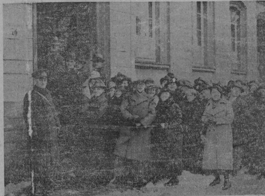
EL PLEBISCITO DEL SARRE.— El entusiasmo patriótico de los sarrenses se ha demostrado de una manera extraordinaria, durante la celebración del plebiscito. Aquí vemos como para depositar su voto, tuvieron que alinearse durante largas horas sobre la nieve y con un frío intensísimo para poder llegar a depositar su voto.