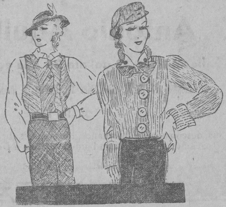
Las blusas de punto, confecciones propias muy gentiles.

La blusa se hace en punto de malla a rayas y tonos a libre elección.