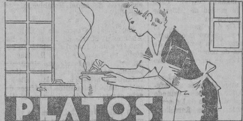
Con las ciruelas se obtienen jarabes sabrosísimos.

La piel, se reafirma, se refresca y la ardencia que tanto daño os producía, está conjurada.