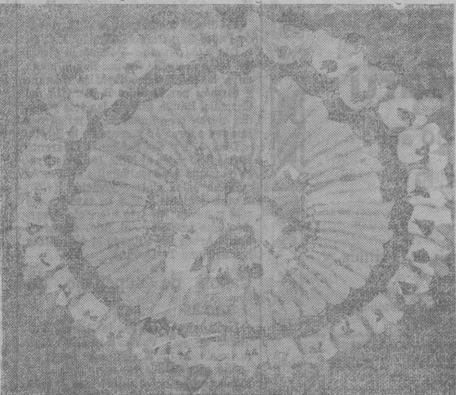
UNA ROSA HUMANA. — Las Victoria Girls, formando una rosa humana; en la pantomina «Robin Hood y los chichillos», representada en el Victoria Palace de Londres.