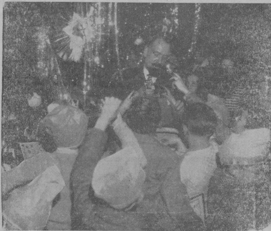
EL ARBOL DE NAVIDAD EN EL AYUNTAMIENTO DE PARIS. — Todos los alumnos de las escuelas municipales parisienses, han sido invitados a una fiesta de Navidad, en el transcurso de la cual M. Contentot, presidente del Consejo Municipal, ha distribuido los juguetes entre los niños. — M. Contentot durante su simpática labor.