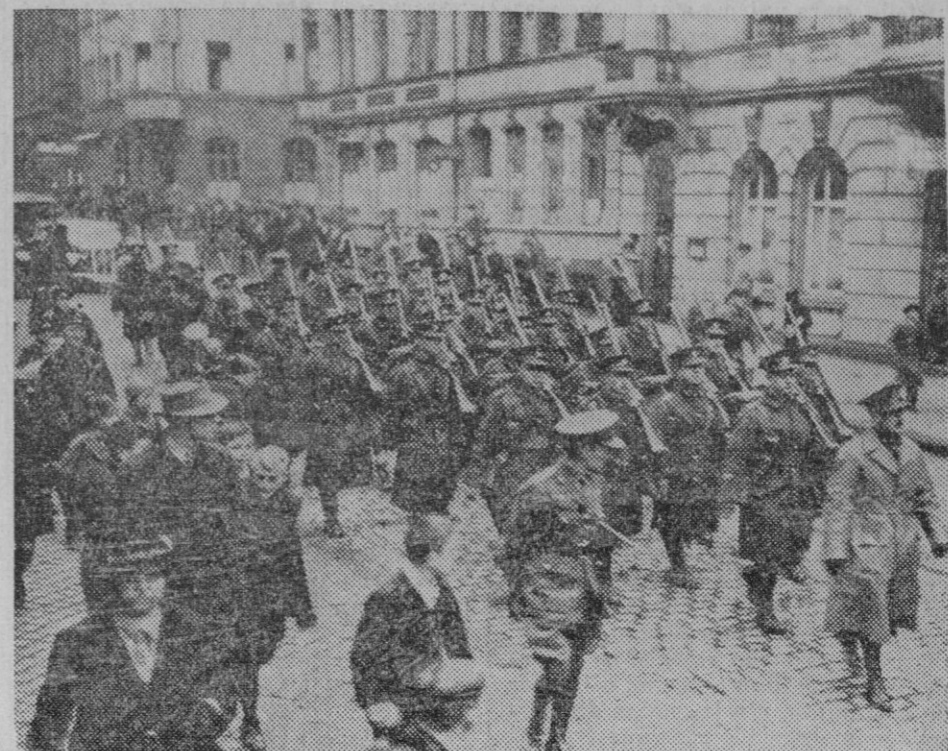
EL PRIMER CONTINGENTE INGLES LLEGA A SARREBRUCK. — Desfile de un destacamento por las calles de la ciudad.