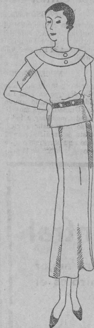
En marroquí de seda a rayas marinas, el cuello se esclarece de un doble hecho en organón blanco. La cintura en gamo azul, montando sobre el fal, don abierto en la espalda.