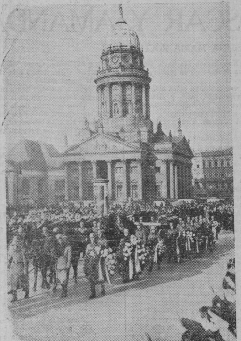
BERLIN. — Entierro del General Von Hutier. — Después de un oficio fúnebre en la catedral de St. Hedwig, los restos del general Von Hutier, cuyo nombre se hizo notable durante la guerra, son conducidos a la estación de Anhalter para ser trasladados a Darmstadt don de recibirán definitiva sepultura.

Ahora ¡qué alegría para los rubios ciudadanos de las orillas del Támesis!, ha vuelto el viejo reloj a su alto sitial del torreón del Parlamento; pero el relojero encargado de su reparación asegura ¡qué dolor! que el famoso «Big-Ben» quedó limpio, pero que sus achaques no tienen remedio.