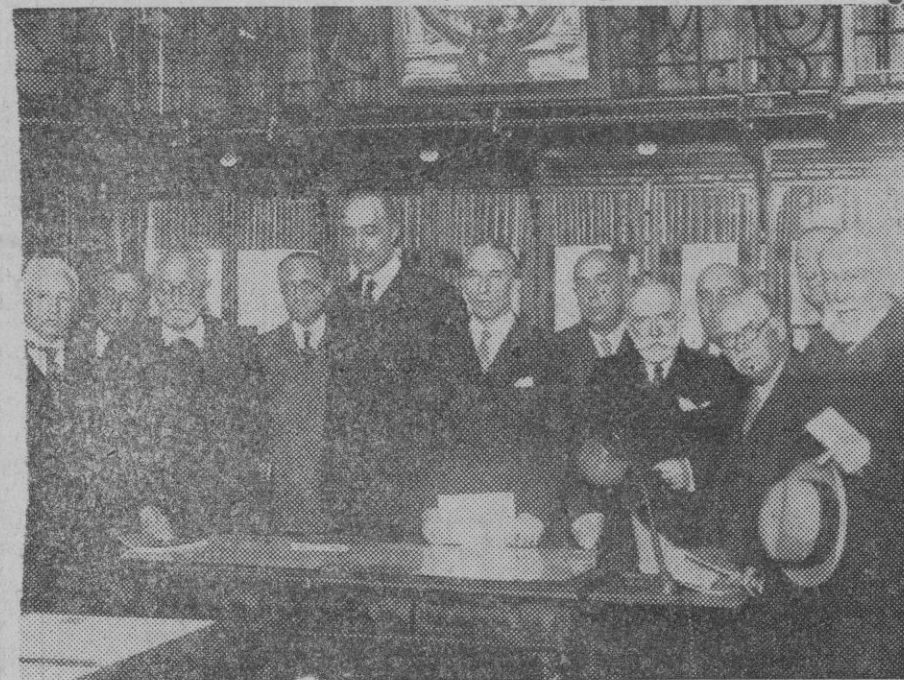
ACADEMIA DE MEDICINA. CONMEMORACION DE SU FUNDACION. — Acto de inauguración de la exposición de Libros y documentos de su archivo y Biblioteca, con motivo del III Centenario.

porque a éste le conviene que aumente la oferta) evitando así que la insuficiencia del mercado sea causa de que se vayan construyendo mercados particulares, los cuales son intereses que se van creando en contra de los intereses de la capital.