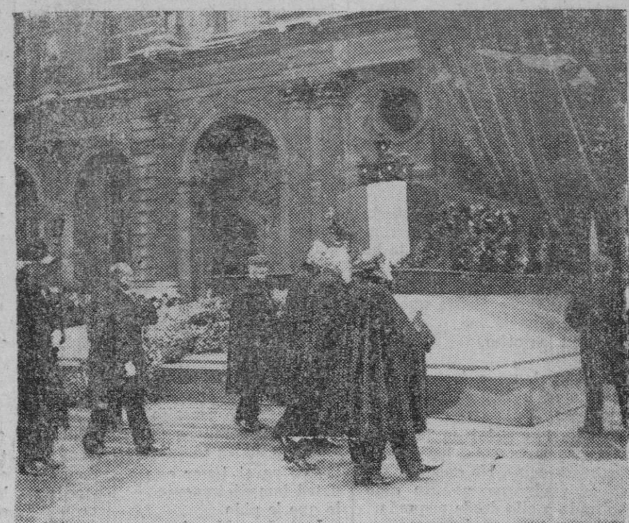
LAS EXEQUIAS DE M. ALBERT BESNARD. — En el patio de Napoleón ante el Museo del Louvre, ha tenido lugar las exequias de M. Albert Besnard, célebre pintor francés. Desfile de los miembros de la Academia francesa y de la Academia de Bellas Artes, ante el catafalco.

Sin embargo de la justificación de la medida y de lo mucho que elevaría su cumplimiento el concepto de rectitud y desinterés de los funcionarios belgas pertenecientes al Partido Laborista, el acuerdo tomado por su Consejo General ha disgustado profundamente a quienes afecta. Según la información aquí aludida, los senadores, diputados y alcaldes socialistas de Bélgica han mostrado su descontento, declarando que no acatarán el acuerdo por considerarlo arbitrario, puesto que para tomarlo se prescindió de la asistencia de la mayoría de los líderes. Claro. Una cosa