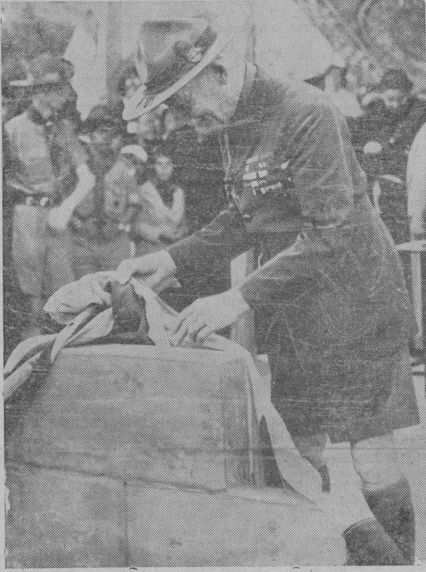
PORT-SAID. — Lord Badel Powell, el anciano jefe de todos los Boy-Scouts del mundo, ha llegado a Port-Said a bordo del «Orama», de paso para Melbourne donde debe efectuarse la Jamboree anual (reunión internacional de boy-scouts). Durante su estancia en Port-Said, Lord Badel Powell ha colocado la primera piedra del edificio en construcción, para cuartel general de los muchachos escultistas egipcios. (Express Foto).

Por estimarlo así hemos de congratularnos de la solución que se ha dado a la difícil situación que el Círculo atravesaba, y hemos de unir nuestro aplauzo a los que se tributan a quienes con su energía e inteligencia han sabido consolidar la vida del Círculo.