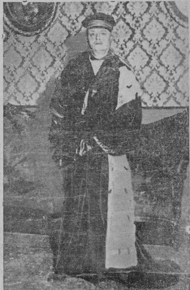
EL PLEBISCITO DEL SARRE. — Un reciente retrato de M. H. E. Bindo Galli, presidente de la Comisión del Sarre.

En calidad de intérprete llevaba Cortés siempre junto a sí una india fidelísima y de maravillosa belleza por la que sentía una avasalladora pasión. También la india que en Tabasco fué bautizada poniéndole por nombre Marina, estaba de Cortés locamente enamorada, era tal el encanto de Cortés ante las múltiples perfecciones de su amada que decía que mirándola a ella encontraba en los destellos de sus ojos las más altas y sublimes concepciones de su empresa y era tal la fascinación que por el caudillo español sentía la