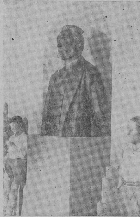
SALAMANCA. — HOMENAJE A UNAMUNO.—Busto que ha sido descubierto en Salamanca con motivo del homenaje nacional que ha sido tributado al Rector de la Universidad salmantina Don Miguel de Unamuno.

Si acaso la Diputación y el Ayuntamiento, estiman favorable la proposición del Estado, creemos que cuanto antes debe ser admitida.