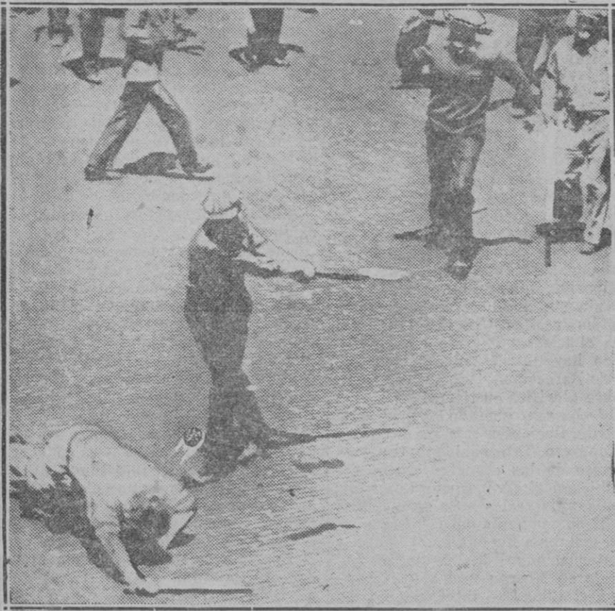
Los conflictos sociales en los Estados Unidos se caracterizan, en estos últimos tiempos, por su extrema violencia. He aquí un documento gráfico que muestra el carácter tumultuoso de las huelgas estadounidenses

Ello es indicio de que las cuestiones que atañen al turismo comienzan a interesar, y cuanto mayor sea el interés que despierten en las esferas oficiales, más posibilidad habrá de que España se dé cuenta de la conveniencia de amparar y proteger la industria del viajero, que tantísima importancia tiene para regiones como la nuestra.