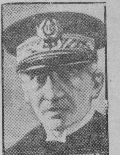
El Vicealmirante Mouget, uno de los nuevos jefes de las escuadras francesas