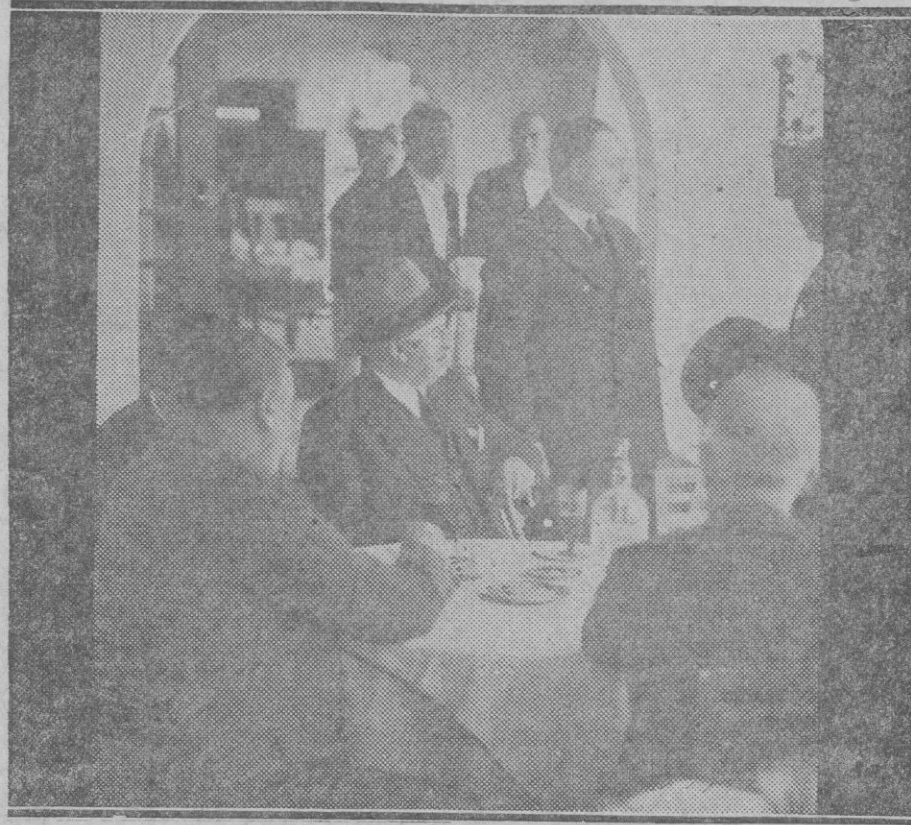
MADRID.—El Sr. Lerroux, durante la comida íntima con que obsequió al señor Martínez Barrios y en la que trataron de asuntos políticos

Y al celebrar la constitución de este grupo parlamentario, deseamos que su gestión resulte eficaz al fin que se ha propuesto.