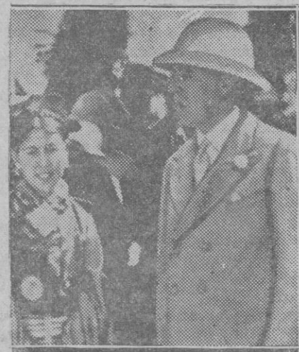
EXTRANJERO.—El Gobernador de Bengala Mr. Anderson que ha sido objeto de un atentado saliendo ileso

La proporción es impresionante y viene a dar la razón a los psicólogos y moralistas que sostienen que un presidio está muy lejos de ser una escuela de regeneración moral para la juventud.